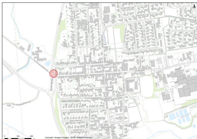
Figur 1: Projektområdets placering

Afgørelsen er truffet efter § 21, stk. 1 Lov om miljøvurdering af planer og projekter 1 .